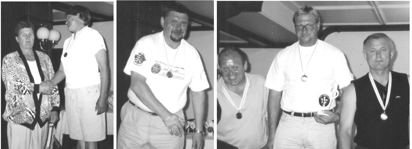
Mūsų sportininkai ant garbės pakilos.