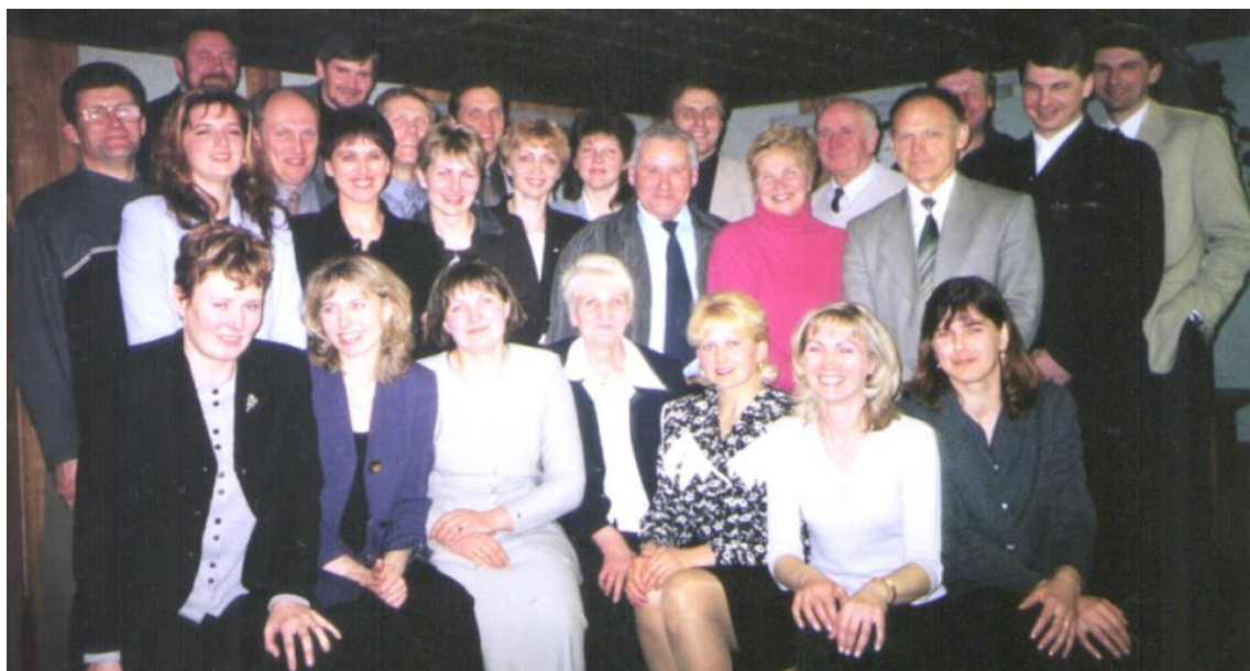
Po steigiamojo susirinkimo.

Propaguoti lengvosios atletikos daugiakovininkų pasiekimus, dalyvauti varžybose, organizuoti įvairius sporto renginius.