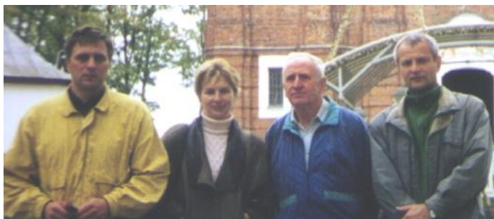
Varžybų laikas sutapo su garsiaisiais Šiluvos atlaidais. Vilniečiai, vykdami į Tytuvėnus, užsuko į Šiluvą ir galėjo pajusti jų dvasią.

Pasibaigus daugiakovių varžyboms visi persikėlė prie ežero, kurio pakrantėje vyko Liberalų sąjungos Kelmės skyriaus šventė. Mūsų veteranės susibūrė į "Pievų gėlės" komandą ir dalyvavo gatvės krepšinio turnyre. Joms sekėsi neblogai - tik finale labai atkakliose rungtynėse jos rezultatu 5:6 nusileido vietos komandai.