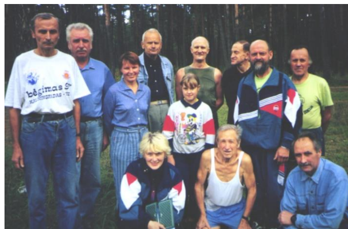
Bėgimo mėgėjų klubo nariai po eilinės treniruotės.

pasiekdamas naują pasaulio rekordą: 16 parų 28 minutės ir 10 sekundžių. Pakeliui jis pagerino ir 2000 km pasaulio bėgimo rekordą – 15 parų 10val. 16min. 2 sek. Tai 13 val. geriau už ankstesnį rekordą.