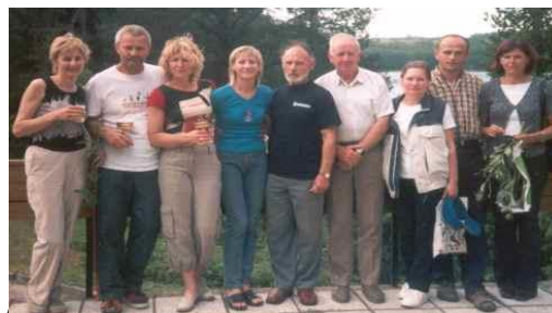
Sporto klubo "7 ir 10" komanda