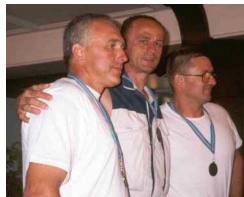
Pasaulio čempionas Saulius Svilainis