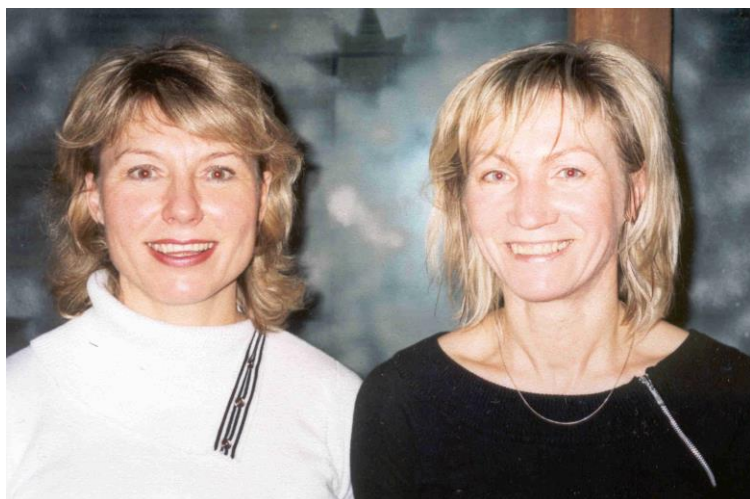
Valdžia pasikeitė be kraujo praliejimo