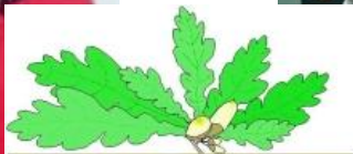
Ažuolas Klaipėdos lengvosios atletikos veteranų sporto klubas